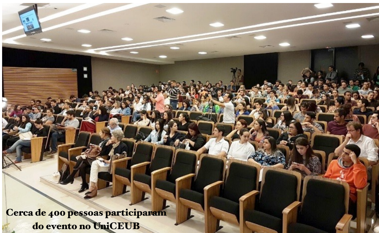
Cerca de 400 pessoas participaram do evento no UniCEUB

Se você quiser conferir as matérias completas dos destaques desta retrospectiva, basta acessar o site do Movimento e clicar na Aba " Sala de Imprensa ".